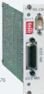
Option 72 & 76