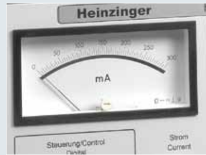
Option 03 analog display